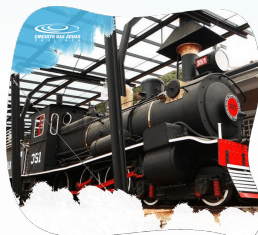
MONTE ALEGRE DO SUL