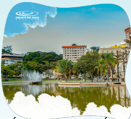
ÁGUAS DE LINDÓIA

Clique abaixo nos ícones e saiba mais sobre cada cidade: